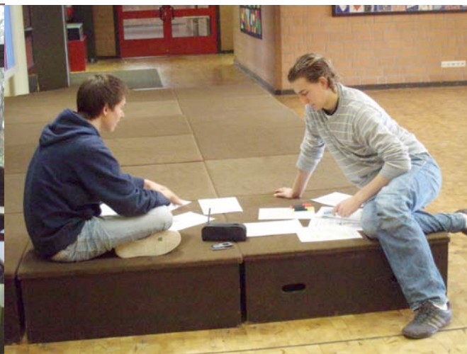
Parlamentsabgeordnete brüten über ihre Strategien