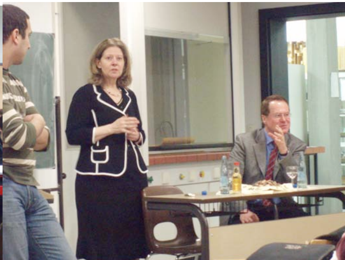
Kompromiss ist geschafft